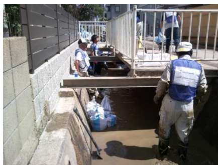
用水路の土砂撤去