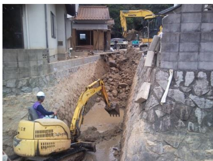
いまだ続く土砂撤去