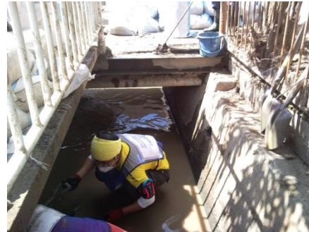
重機が入れない場所は人力です。